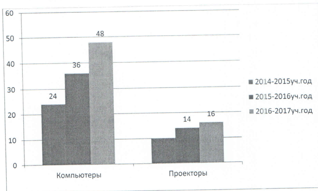
Таблица № 2. Обеспечение библиотечными ресурсами